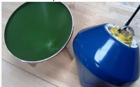
La « sentinelle des glaces ».