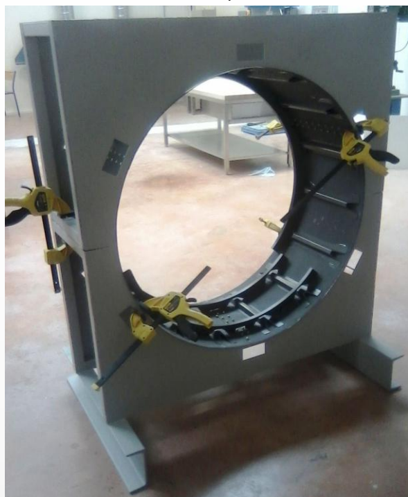
Fuselage aéronautique (fabrication et assemblage).